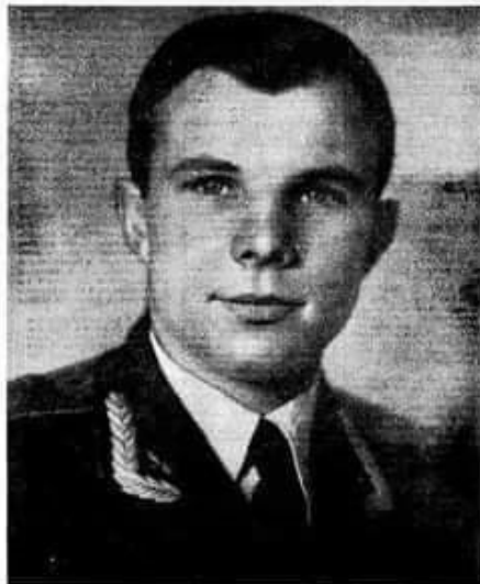
ЮРИ АЛЕКСАНДРОВИЧ ГАГАРИН. ПРЫЖОК ВО ВСЕЛЕННУЮ

Великая победа разума и труда МИР РУКОПЛЕЩЕТ ЮРИЮ ГАГАРИНУ